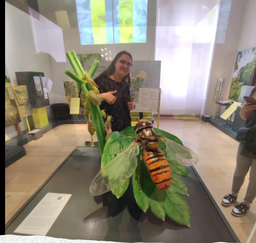
Senckenberg Nature Museum - prirodoslovni muzej