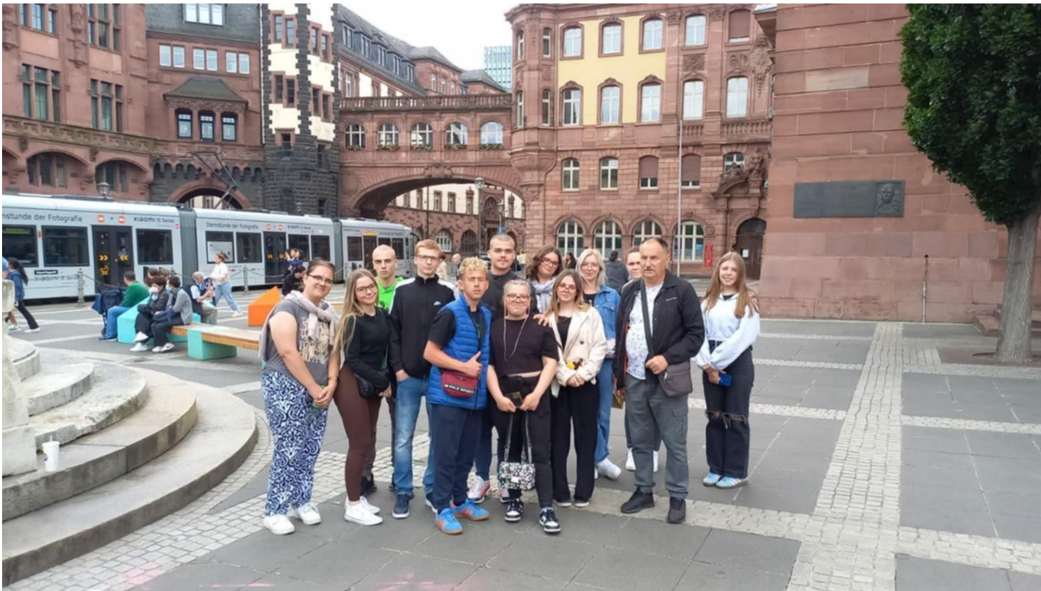
Stari grad Rómer