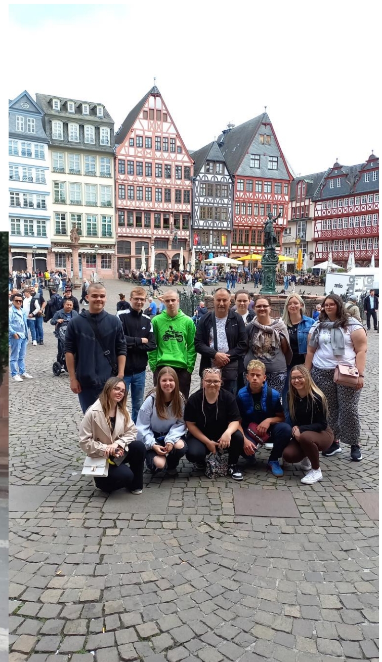
Glavni Trg Rómer